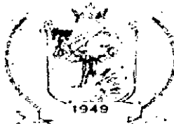
FIG. Nº 153 Data Nº 014/2003 13