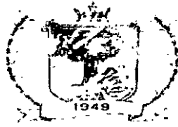
Fig. Nº 156 Proc. Nº 014/2003 Data: 8

ESTADO DO MARANHÃO CÂMARA MUNICIPAL DE MATINHA Praça Raimundo Penha, S/N – Centro-Matinha/MA- CEP: 65.218-000 CNPJ Nº 12.526.216/0001-74