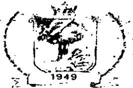
Fig. Nº 143 Proc. Nº 014/2003 Esp. 8